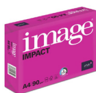
Image Impact Kopierpapier A4