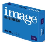
Image Business Kopierpapier A4